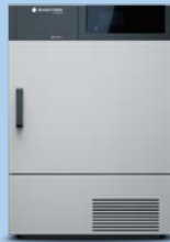
topLine TW Pierre MQA0.109