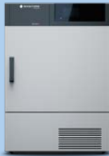
topLine TC Pierre MTA0.109