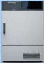
topLine TA Pierre MWA0.109